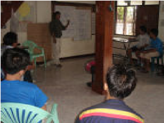
Kayen New Generation Youth ရုံးမှ

ကယန်းလူငယ်မျိုးဆက်သစ် (KNGY) အဖွဲ့၏ အစီအစဉ်ဖြင့် ကယန်းလူငယ်များရုံး၌ပြုလုပ်သော နိုင်ငံရေးအရည်အသွေးဆိုင်ရာ မြှင့်တင်ရေးသင်တန်းကို ၂၀၀၆ ခုနှစ် ဇွန်လ (၁၂) ရက်မှ ဇူလိုင်လ (၁၆) ရက်အထိ ကျင်းပခဲ့ပါသည်။