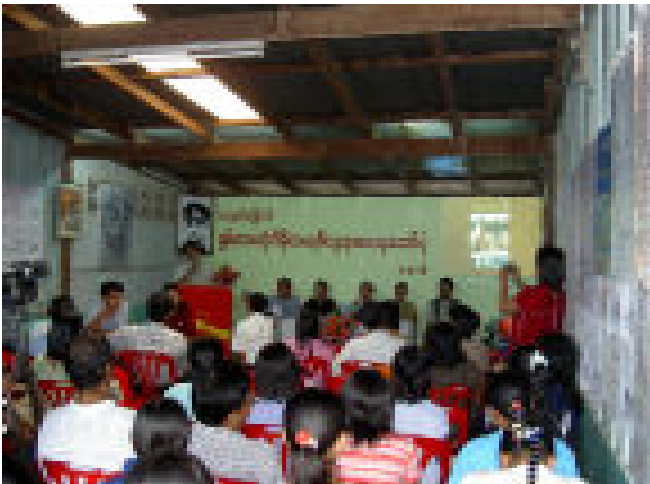
အဘီအက်ဒီအက်ဖ်ရုံး၌

၂၀၀၆ ခုနှစ် ဩဂုတ်လ (၈)ရက်နေ့တွင် (၁၈)နှစ်မြောက် ရှစ်လေးလုံး ဒီမိုကရေစီအရေးတော်ပုံနေ့ အခမ်းအနားကို ထိုင်း-မြန်မာနယ်စပ်တနေရာရှိ မြန်မာနိုင်ငံလုံးဆိုင်ရာကျောင်းသားများ ဒီမိုကရက်တစ်တပ်ဦးရုံး၌ ကျင်းပခဲ့ပါသည်။ ထိုအခမ်းအနားကို မြန်မာနိုင်ငံဒီမိုကရက်တစ်အင်အားစုမှ ဦးဆောင်ကျင်းပပြီး NLD-LA/ MPU/ SYCB၊ နယ်စပ်ရှိ ဒီမိုကရေစီအင်အားစုများ၊ အလုပ်သမားအဖွဲ့အစည်းများတို့နှင့် အခမ်းအနားဖြစ်မြောက်ရေးကော်မတီတစ်ရပ်ကို ဖွဲ့စည်းခဲ့ပါသည်။ လူ့အင်အား (၂၀၀) ကျော် တက်ရောက်ခဲ့ကြပါသည်။