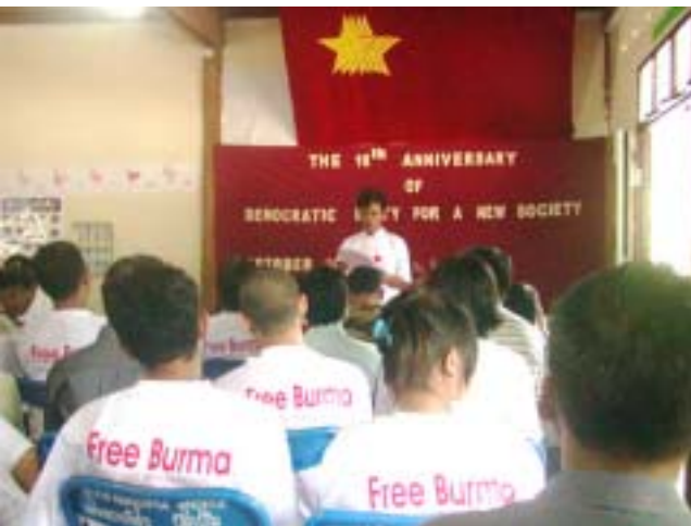
တွဲဘက်အထွေထွေအတွင်းရေးမှူး ၂ ကိုငွေလင်း ပါတီ၏ကြေငြာချက်အား ဖတ်ကြားနေစဉ်။

လူ့ဘောင်သစ်ဒီမိုကရက်တစ်ပါတီ တည်ထောင်ခြင်း ၁၆ နှစ် မြောက် အခမ်းအနားကို အောက်တိုဘာလ ၁၄ ရက်၊ နံနက် ၉ နာရီ အချိန်က ထိုင်း မြန်မာ နယ်စပ် တစ်နေရာတွင် ကျင်းပပြုလုပ်ခဲ့ရာ မဟာမိတ် အဖွဲ့အစည်းအသီးသီးမှ အင်အား ၁၀၀ ခန့် တက်ရောက်ခဲ့ကြသည်။