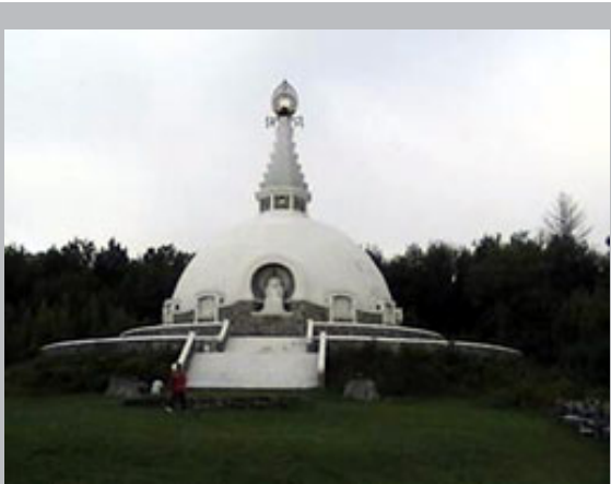
ခရီးရှည်ချီတက်ပွဲစတင်ရာ ငြိမ်းချမ်းရေးစေတီ

ယခုကဲ့သို့ သွားရောက်တောင်းဆိုခဲ့ကြသူများသည် ရန်ကုန်တိုင်း၊ မကွေးတိုင်း၊ ဧရာဝတီတိုင်းနှင့် ပဲခူးတိုင်းတို့မှ အဖွဲ့ချုပ်ဝင်များ ဖြစ်ကြောင်း နှင့် ၎င်းတို့၏အမည်များကိုပါ ဖော်ထုတ်ပြောဆိုခဲ့ကြကြောင်းသိရသည်။