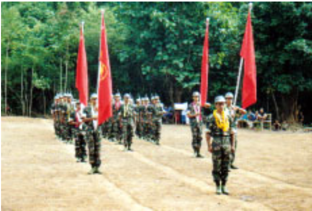
မကဒတူထောင်ခြင်း ၁၅ နှစ်ပြည့် စစ်ရေးပြအခမ်းအနား ပြုလုပ်စဉ်

မြန်မာနိုင်ငံလုံးဆိုင်ရာ ကျောင်းသားများ ဒီမိုကရက်တစ်တပ်ဦး (ABSDF) ဗဟိုစစ်ကော်မရှင်၏ ကြီးကြပ်မှုဖြင့် စစ်ရုံးချုပ်မှ ဦးစီး ဖွင့်လှစ်သော တပ်မှူးငယ်သင်တန်း အမှတ်စဉ် ၃/၂၀၀၄ ကို ၂၀၀၄ ခုနှစ် ဩဂုတ်လ ၃ ရက်နေ့တွင် ဥက္ကဋ္ဌ ရဲဘော်သံခဲက သင်တန်းဖွင့်အမှာစကား ပြောကြားပြီး ဖွင့်လှစ်ခဲ့သည်။