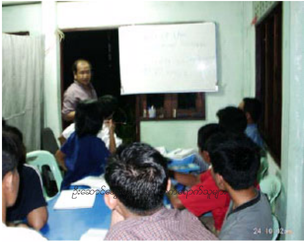
ဦးဆောင်ဆွေးနွေးပွဲတက်ရောက်သူများ

ပြည်သူ့ကာကွယ်ရေးတပ် (People's Defence Force) ဗဟိုရုံးတွင် တရားဥပဒေစိုးမိုးရေးဘာသာရပ် ရုံးတွင်းဆွေးနွေးပွဲကို စက်တင်ဘာ ၂၀ ရက်နေ့မှ ၂၃ ရက်နေ့အထိ ပြုလုပ်ခဲ့သည်။