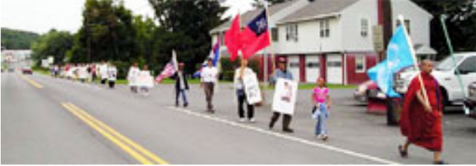
ခရီးရှည်ချီတက်ပွဲ

ခရီးရှည်ချီတက်ပွဲကို ၂၀၀၄ ခုနှစ် စက်တင်ဘာလ ၁ ရက် ဗုဒ္ဓဟူးနေ့တွင် နယူးယောက်ပြည်နယ်၊ အယ်လ်ဘာနီမြို့အနီးရှိ ဂြိုမ်းချမ်းရေးစေတီမှ စတင် ခဲ့ပြီး နယူးယောက်မြို့ရှိ ကမ္ဘာ့ကုလသမဂ္ဂရုံးချုပ်သို့ ဦးတည် ချီတက်ခဲ့ကြ ခြင်းဖြစ်သည်။ စက်တင်ဘာလ ၂၁ ရက်နေ့တွင် နယူးယောက်မြို့ ကုလ သမဂ္ဂအဆောက်အဦးရှေ့ 47th Street and 1st Ave ရှိ Dag Hammerskjold Park တွင် ခရီးရှည်ချီတက်ပွဲ အောင်မြင်စွာ ပြီးဆုံးခြင်း