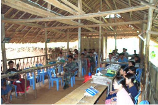
သင်တန်းတက်ရောက်သူများ

မြန်မာနိုင်ငံလုံးဆိုင်ရာ ကျောင်းသားများ ဒီမိုကရက်တစ်တပ်ဦး (မကဒတ) (ABSDF) နှင့် မြန်မာနိုင်ငံရှေ့နေများကောင်စီ (Burma Lawyers' Council) တို့ ညှိနှိုင်းပူးပေါင်းဆောင်ရွက်သော “ဒီမိုကရေစီ လူ့အဖွဲ့အစည်းအတွင်း တပ်မတော်၏အခန်းကဏ္ဍအား ဖွဲ့စည်းပုံအခြေခံ ဥပဒေရှုထောင့်မှ ချဉ်းကပ်ခြင်း” ခေါင်းစဉ်ဖြင့် ဆွေးနွေးပွဲတစ်ခုအား ၂၀၀၄ ခုနှစ် ဇူလိုင်လ ၅ ရက်မှ ၁၇ ရက်နေ့အထိ စစ်ရုံးချုပ် အခြေပြုရာ ဗဟိုဌာန