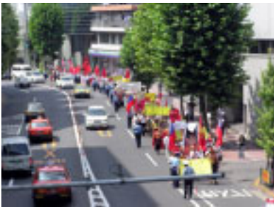
ချီတက်လာသော ဆန္ဒပြသူများ

၁၆ နှစ်မြောက် ရှစ်လေးလုံးအထိမ်းအမှတ် ချီတက်ဆန္ဒပြပွဲတရပ်ကို ၂၀၀၄ ခုနှစ် ဩဂုတ်လ ၈ ရက်နေ့က ဂျပန်နိုင်ငံတွင် ပြုလုပ်ခဲ့သည်။ အင်အား ၂၀၀ နီးပါးခန့် ပါဝင် လှုပ်ရှားခဲ့သည့် အဆိုပါ ချီတက်ဆန္ဒပြပွဲတွင် မြန်မာ့ ဒီမိုကရေစီအဖွဲ့ ချုပ်