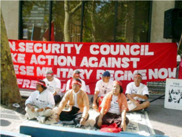
အစာငတ်ခံ ဆန္ဒပြနေသူများ

မြန်မာ့ဒီမိုကရေစီရေးအတွက် ကုလသမဂ္ဂမှ ထိရောက်စွာ ကိုင်တွယ် ဖြေရှင်းရေးတောင်းဆိုချက်ဖြင့် ခရီးရှည်ချီတက်ပွဲတရပ်ကို အမေရိကန်နိုင်ငံ ရောက် မြန်မာ့ဒီမိုကရေစီရေး လှုပ်ရှားသူများက ပြုလုပ်ခဲ့ကြောင်းနှင့် ဆက်လက်၍ အစာငတ်ခံဆန္ဒပြပွဲကိုလည်း ပြုလုပ်လျက်ရှိကြောင်း သိရှိရသည်။