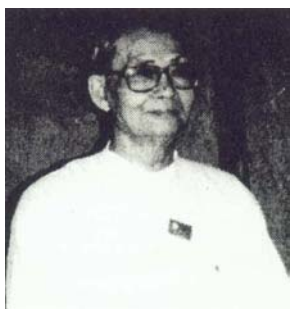
ဦးစိုးမြင့် (သခင် စိုးမြင့်) အဖွဲ့ဝင် ပြည်သူ့လွှတ်တော်ကိုယ်စားပြုကော်မတီ ဗဟိုအလုပ်အမှုဆောင်ကော်မတီဝင် အမျိုးသားဒီမိုကရေစီအဖွဲ့ချုပ် ရန်ကုန်တိုင်း၊ တောင်ဥက္ကလာပမြို့နယ် မဲဆန္ဒနယ်အမှတ် (၁) ပြည်သူ့လွှတ်တော်ကိုယ်စားလှယ်

၁၉၂၇ ခုနှစ် ဇန်နဝါရီလ (၁၉) ရက်နေ့တွင် မွေးဖွားသည်။ ဧရာဝတီတိုင်း အမျိုးသားဒီမိုကရေစီအဖွဲ့ချုပ် ဗဟိုအလုပ်အမှုဆောင်ကော်မတီဝင်ဖြစ်သည်။ ပါလီမန်ဒီမိုကရေစီကာလ ၁၉၅၁ ခုနှစ်မှ ၁၉၆၁ ခုနှစ်အတွင်း မော် လမြိုင်ကျွန်းမြို့နယ် လွှတ်တော်အမတ်အဖြစ်ဖြစ်ခဲ့သည်။ ၁၉၆၇ ခုနှစ်မှ ၁၉၈၆ ခုနှစ်အတွင်း ပို့ဆောင်ဆက်သွယ်ရေး ဝန်ကြီးဌာန အရာရှိအဖြစ် အမှုထမ်းခဲ့သည်။