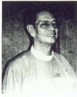
ဦးလှဖေ အဖွဲ့ဝင် ပြည်သူ့လွှတ်တော်ကိုယ်စားပြုကော်မတီ ဗဟိုအလုပ်အမှုဆောင်ကော်မတီဝင် အမျိုးသားဒီမိုကရေစီအဖွဲ့ချုပ် ဧရာဝတီတိုင်း၊ ဗမာလမြိုင်ကျွန်း မဲဆန္ဒနယ်အမှတ် (၁) ပြည်သူ့လွှတ်တော်ကိုယ်စားလှယ်

၁၉၂၄ ခုနှစ်၊ စက်တင်ဘာလ (၂၂) ရက်နေ့တွင် မွေးဖွားသည်။ မဆလလက်ထက် ဒု - ဝန်ကြီးချုပ်နှင့် မဆလပါတီဝင်ဖြစ်ခဲ့သည်။ ၁၉၄၂ ခုနှစ် မှ ၁၉၄၅ ခုနှစ်အထိ ဗမာ့လွတ်လပ်ရေးတပ်မတော်နှင့် ဗမာ့ကာကွယ်ရေး တပ်မတော်တို့တွင် တာဝန်ထမ်းဆောင်ခဲ့သည်။ ဂျပန်တော်ဝင်စစ်သင်တန်းကျောင်းနှင့် ဗြိတိသျှတော်ဝင်စစ်သင် တန်းကျောင်းတို့၌ ဆည်းပူးခဲ့သည်။ အမေရိကန်နိုင်ငံဆိုင်ရာ စစ်သံမှူးအဖြစ်လည်း အမှုထမ်းခဲ့ဖူးသည်။