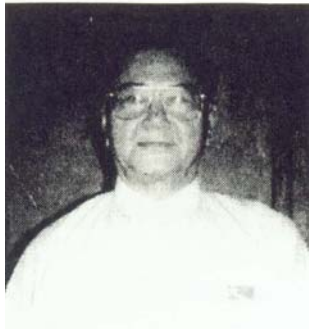
ဦးလွင် အဖွဲ့ဝင် ပြည်သူ့လွှတ်တော်ကိုယ်စားပြုကော်မတီ ဗဟိုအလုပ်အမှုဆောင်ကော်မတီဝင် အမျိုးသားဒီမိုကရေစီအဖွဲ့ချုပ် ရန်ကုန်တိုင်း၊ သုံးခွမြို့နယ် မဲဆန္ဒနယ်အမှတ် (၁) ပြည်သူ့လွှတ်တော်ကိုယ်စားလှယ်

၁၉၂၄ ခုနှစ်၊ စက်တင်ဘာလ (၂၂) ရက်နေ့တွင် မွေးဖွားသည်။ မဆလလက်ထက် ဒု - ဝန်ကြီးချုပ်နှင့် မဆလပါတီဝင်ဖြစ်ခဲ့သည်။ ၁၉၄၂ ခုနှစ် မှ ၁၉၄၅ ခုနှစ်အထိ ဗမာ့လွတ်လပ်ရေးတပ်မတော်နှင့် ဗမာ့ကာကွယ်ရေး တပ်မတော်တို့တွင် တာဝန်ထမ်းဆောင်ခဲ့သည်။ ဂျပန်တော်ဝင်စစ်သင်တန်းကျောင်းနှင့် ဗြိတိသျှတော်ဝင်စစ်သင် တန်းကျောင်းတို့၌ ဆည်းပူးခဲ့သည်။ အမေရိကန်နိုင်ငံဆိုင်ရာ စစ်သံမှူးအဖြစ်လည်း အမှုထမ်းခဲ့ဖူးသည်။