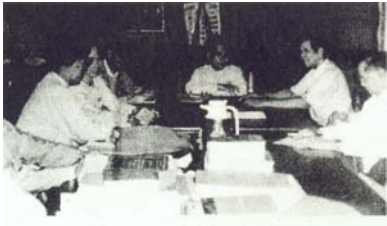
ပြည်သူ့လွှတ်တော်ကိုယ်စားပြုကော်မတီ ဖွဲ့စည်းအစည်းအဝေးကျင်းပနေစဉ်