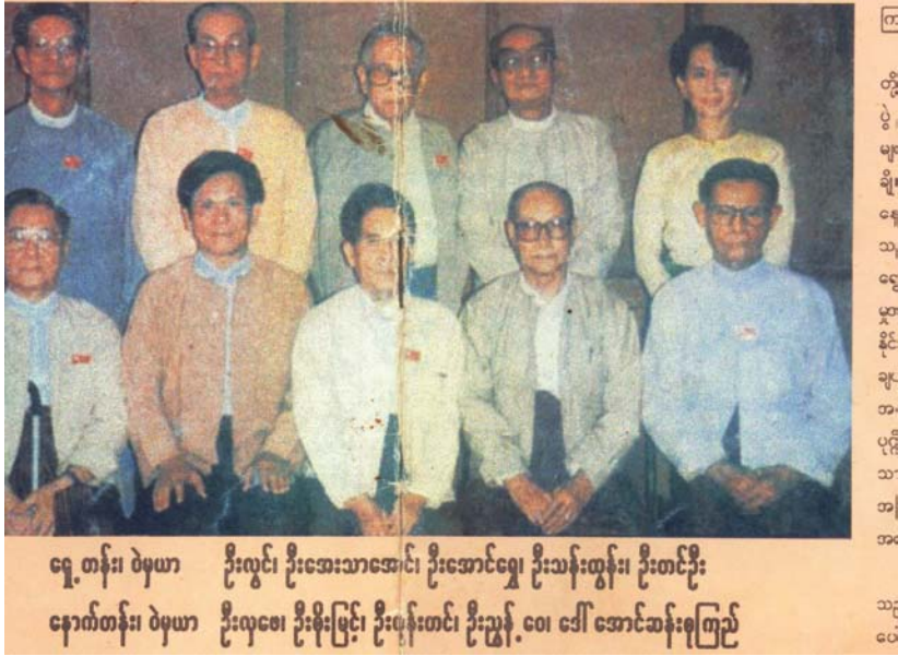
ဇေယျာ တန်း၊ ဝဲမှယာ ဦးလွင်၊ ဦးအေးသာအောင်၊ ဦးအောင်ဇေယျာ၊ ဦးသန်းထွန်း၊ ဦးတင်ဦး နောင်တန်း၊ ဝဲမှယာ ဦးလှဝေ၊ ဦးစိုးမြင့်၊ ဦးဖုန်းတင်၊ ဦးညွန့် ဝေ၊ ဒေါ်အောင်ဆန်းစုကြည်

၁၉၉၀ ပြည့်နှစ် ရွေးကောက်ပွဲပြီးသည့်ကာလမှစ၍ အကြိမ်ပေါင်းများစွာ၊ နည်းလမ်းပေါင်းများစွာအသုံးပြုပြီး ၁၉၉၀ပြည့်နှစ် ရွေးကောက်ပွဲမှတစ်ဆင့် ဖော်ပြခဲ့သည့် ပြည်သူ့လူထုဆန္ဒကို အကောင်အထည်ဖော်နိုင်ရေးအတွက် ပြည်သူ့လွှတ်တော်ခေါ်ယူပေးရန် (အမှန်မှာ ပြည်သူ့လွှတ်တော်ကိုယ်စားပြုကော်မတီရွေးကောက်ပွဲ ဥပဒေ တွင် လည်းကောင်း၊ ၁/၉၀ အရလည်းကောင်း၊ နဝတ မှ ကတိပြုပြီးဖြစ်သည်) အကြိမ်ကြိမ်တောင်းဆိုခဲ့သည်။ (၁၀) နှစ်နီးပါးတိုင် စိတ်ရှည်လက်ရှည်သည်းခံလျက် တောင်းဆို၍မရသည့်အဆုံးတွင် ပြည်သူ့လွှတ်တော်ခေါ်ယူရေးသည် နအဖ အတွက်သာ တာဝန်ရှိသည်မဟုတ်၊ အရွေးချယ်ခံ ပြည်သူ့လွှတ်တော်ကိုယ်စားလှယ်များတွင်ပါ အဓိကတာဝန်ရှိသည်ဟု ယူဆလျက်၊ ပြည်သူ့လွှတ်တော်ခေါ်ယူရေးရည်ရွယ်ချက်ဖြင့် ပြည်သူ့လွှတ်တော်ကိုယ်စားပြုကော်မတီကို ဖွဲ့စည်းခဲ့ခြင်းဖြစ်သည်။