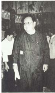
ဦး(နု)ဇွန်(၉၅၅) ရှမ်းတိုင်းရင်းသားများဒီမိုကရေစီ အဖွဲ့ချုပ်(၅၃)နှစ်မြောက်ပြည်ထောင် ရမနု အမင်းအနားသို့ တော်ဝင် လာစဉ်

(င) အမှုခေါ် စာချွန်တော်အမိန့် ( Certiorari)